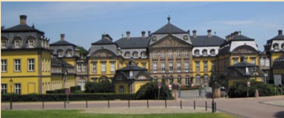
Residenzschloss, Bad Arolsen

Bad Arolsen, die barocke Residenzstadt, die auch liebevoll das „Versailles Hessens“ genannt wird, liegt etwa 45 km westlich der Hessenmetropole Kassel im Waldecker Land. Bad Arolsen ist ein romantisches Barockstädtchen mit schönen Fachwerkhäusern, gemütlichen Straßen und zahlreichen historischen Sehenswürdigkeiten. Bekannt ist Bad Arolsen durch das Residenzschloss, das im Barockstil in den Jahren 1713-1728 erbaut wurde. Königin Emma der Niederlande wurde hier 1858 geboren.