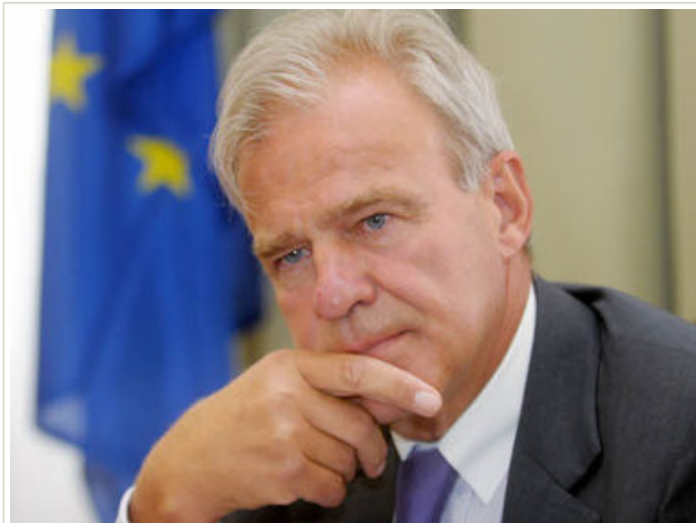
Veit Sorger, Präsident der Industriellenvereinigung

Veit Sorger, Präsident der Industriellenvereinigung, über die richtige Antwort auf die Herausforderung der Globalisierung.