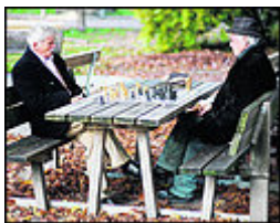
Schach dem Hirnabbau: So bleibt man fit.