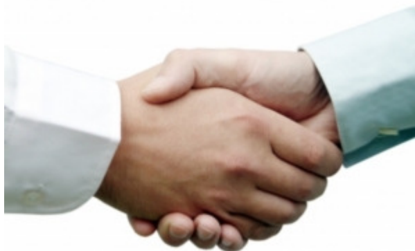
Jung und Alt arbeiten häufig besser zusammen

Mannheim/Hockenheim (pte/06.05.2009/06:20) - Unbegründete Vorurteile sind die häufigsten Ursachen dafür, warum viele Unternehmen trotz Fachkräftemangels noch immer davor zurückschrecken, ältere Arbeitnehmer einzustellen. Da Mitarbeiter ab 50 trotzdem Höchstleistung erbringen können, sollten Personaler nicht primär das Alter sondern vielmehr die langjährige Berufserfahrung zum Entscheidungskriterium machen. Obwohl das Problem des Einstellungsstopps der sogenannten Generation 50plus in den letzten Jahren spürbar abgenommen hat, bleibt der Anteil der Neueinstellungen älterer Erwerbstätiger auch weiter konstant. Dem aktuellen Alterübergangs-Report 2009 der Hans-Böckler-Stiftung http://www.boeckler.de nach macht dieser bereits seit Jahren nur rund zehn Prozent aller Neueinstellungen aus. Die geburtenstarken Jahrgänge (1955-1965) sind besonders betroffen.